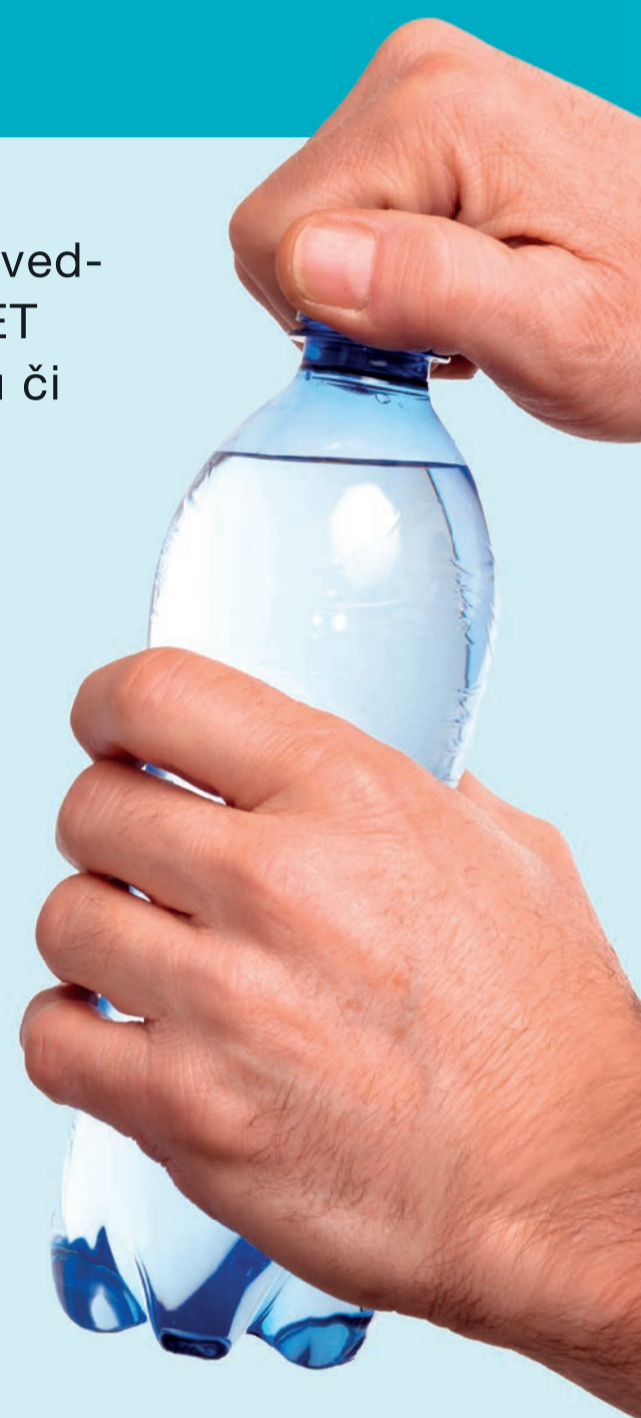
Způsoby otevírání PET lahví (Celá populace)

Výzkum v neposlední řadě ukázal, že 5 % obyvatel ČR otevírá PET lahve pomocí zubů.