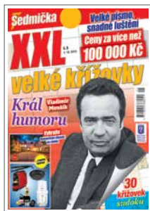
1/1 do zrcadla 205×273 mm na spad 230×303 mm