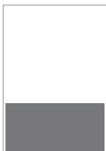
1/3 do zrcadla 185×84 mm na spad 215×99 mm