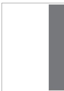
1/4 do zrcadla 42,5×255 mm na spad 57,5×295 mm