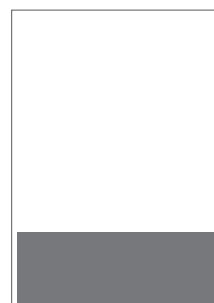
1/4 do zrcadla 185×60 mm na spad 215×75 mm