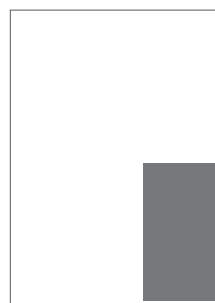
1/6 do zrcadla 58×134 mm na spad 73×148 mm

V případě formátů na spad je nutné přidat spadátku 5 mm u všech ořezových stran.