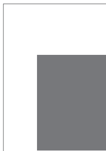
Junior page do zrcadla 137×186 mm na spad 152×199 mm