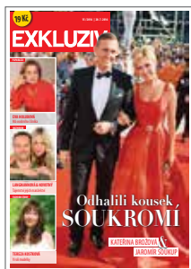
1/1 do zrcadla 185×255 mm na spad 215×295 mm